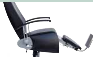
ausziehbar mit Fußstütze extendable with footrest