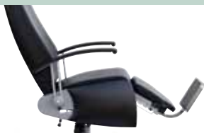
standard mit Fußstütze standard with footrest