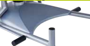
1 Pumphebel, beidseitig (hvh)