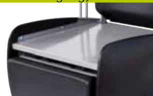
removable seat cushion (for cleaning)