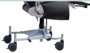
hv hydraulisch höhenverstellbar hydraulically height adjustable