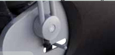
2 manuel manually