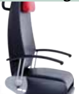
Aufstehhilfe standing up aid