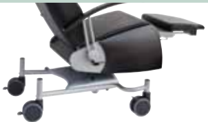
fix nicht höhenverstellbar not adjustable in height