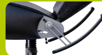
armrests can be swung away