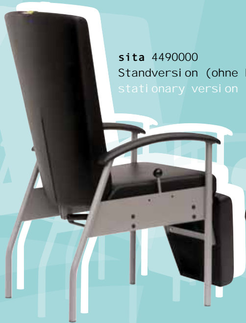
sita 4490000 Standversion (ohne Rollen und Schubbügel) stationary version (without castors and handle)

Groß dimensionierte Polsterflächen, die verschiebbare, integrierte Nackenrolle und die gepolsterten Armauflagen sorgen für hohen Komfort in jeder Position der Liege – die Seitenteile bieten gleichzeitig Schutz gegen Herausfallen. Das robuste Untergestell aus beschichtetem Stahl verfügt in der fahrbaren Version über vier einzelgebremste, total feststellbare Doppelrollen (ø 100 mm). Mit dem sita Zubehörprogramm (Rückseite) kann die Liege praxisnah ausgerüstet werden.