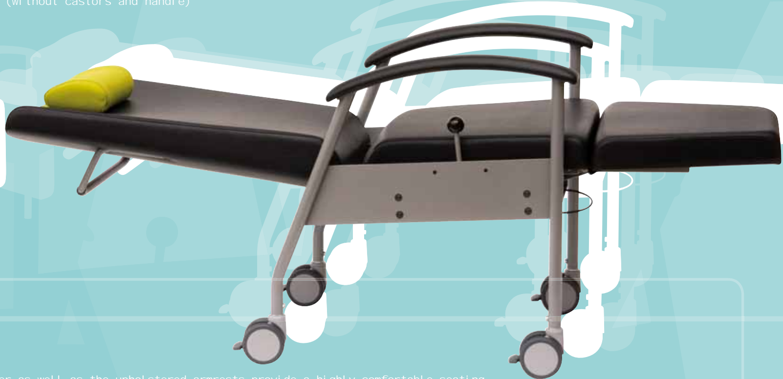
sita 4490200 in Liegeposition horizontal position

Large cushions, the integrated movable bolster as well as the upholstered armrests provide a highly comfortable seating of the patient in every chair position – in addition the side parts avoid the patient falling off the chair. Mobile sita chairs have a sturdy frame of coated steel with four double castors (ø 100 mm) that can individually be locked. With the sita accessories the chair can be equipped according to one's requirements.