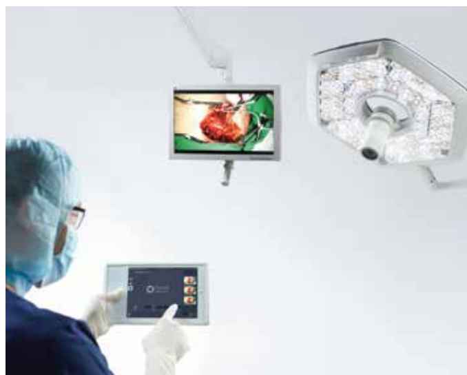
TruVidia Wireless enregistre des images de qualité Full-HD et garantit une haute sécurité des données par transmission cryptée

L'interface de l'adaptateur universel de poignée vous permet de combiner directement l'éclairage opératoire iLED® 7 avec TruVidia® wireless, le système de caméra sans fil innovant qui capture des images en qualité Full-HD. La fonction « cliché » permet de réaliser des photos instantanées. La technologie sans fil offre l'avantage de pouvoir installer ou ajouter ce système sans frais supplémentaire, ni câblage vidéo complexe, et de le commander depuis une tablette mobile ou une console murale fixe.