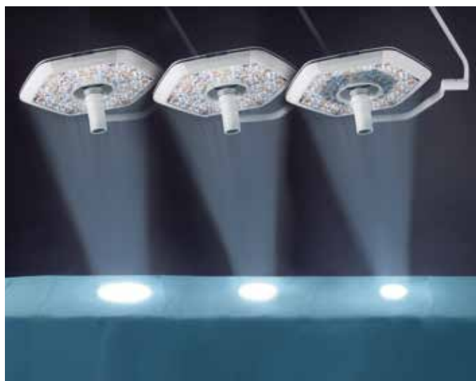
Pour les distances de travail quotidiennes, vous pouvez opter pour trois tailles différentes de champ éclairé

Pour les distances de travail de 0,8 à 1,3 mètre fréquemment utilisées au bloc opératoire, l'éclairage opératoire iLED® 7 propose des champs éclairés de dimensions constantes. La fonction exclusive SmartPattern offre trois options de taille différentes. Une fois que le choix a été fait, l'éclairage opératoire iLED® 7 conserve automatiquement la taille de champ sélectionnée – même si vous modifiez manuellement la distance de travail avec la zone opératoire.