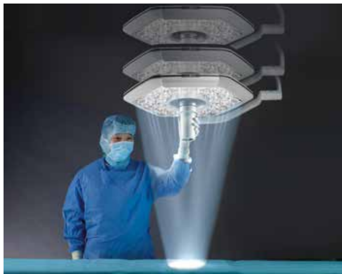
Des conditions d'éclairage constantes quelque soit la distance

En cas de modification de la distance de travail habituelle, l'éclairage opératoire iLED® 7 adapte automatiquement la taille du champ éclairé et l'intensité lumineuse jusqu'à 160 000 lux grâce au capteur 3D. Vous bénéficiez toujours d'une qualité d'éclairage constante dans votre travail sans aucune mise au point manuelle. Cette focalisation automatique vous fait gagner du temps tout en facilitant votre concentration sur la zone opératoire et prévient la fatigue oculaire pouvant survenir lors de longues interventions.