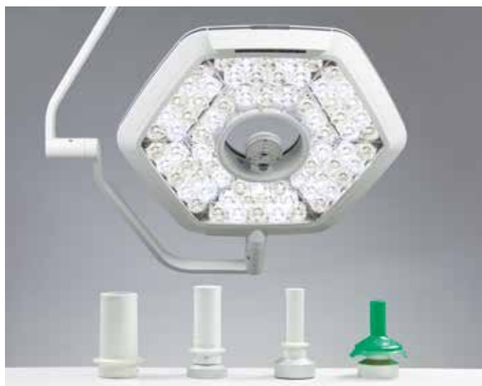
L'adaptateur universel permet de fixer différentes poignées

L'adaptateur universel de poignée permet d'adapter l'éclairage opératoire iLED® 7 à chaque exigence d'intervention. Vous pouvez opter pour une poignée stérilisable ou des poignées à usage unique. Si vous souhaitez utiliser la caméra sans fil TruVidia® wireless dès aujourd'hui ou à l'avenir, vous pouvez également la fixer sans aucune transformation.