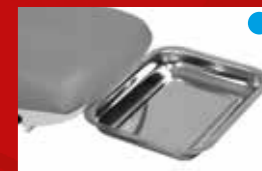
Vastklembaar vierkant RVS bakje Ref. 2864-01

Eenvoudig te onderhouden kleur: Grijs met gebroken wit als contrastkleur.