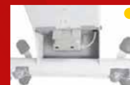
Accu Ref. 2892-01