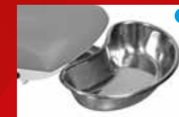
Vastklembaar RVS bakje Ref. 2864-10