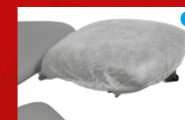
Wegwerp beenbeschermers verkocht per 100 stuks Ref. 2804-01