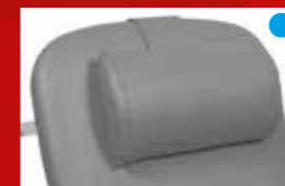
Verstelbare hoofdsteun Ref. 2802-01