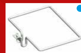
Afvalzakhouder Ref. 2874-01 10 rollen van 20 vuilniszakken Ref. 962