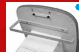
Papierrolhouder max. breedte 50 cm, diam. 20 cm - Ref. 167-10