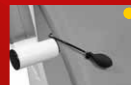
Lendensteunsysteem met opblaaspeer die door de patiënt wordt bediend Ref. 2880-01